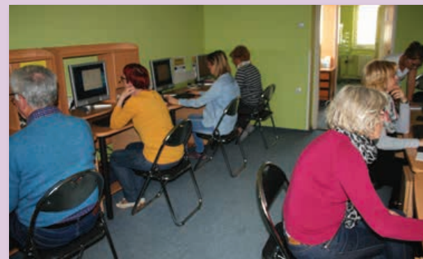
ŠK računalništvo II. sk.

Študijski krožek je izobraževalna oblika prostovoljnega skupinskega dela. Odrasli novo znanje povezujejo z že pridobljenim znanjem in izkušnjami, s katerimi gradijo oziroma nadgrajujejo svoje znanje. Študijski krožki pomembno vplivajo na zadovoljevanje potreb po varnosti, socialni pripadnosti skupini, čustvenem navezovanju, samopotrjevanju, raziskovanju in odkrivanja neznanega.