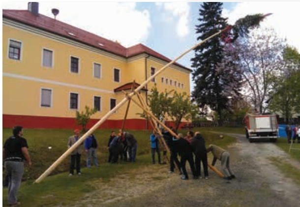
Majsko drevo pred gasilskim domom Lokavec.

V nedeljo, 7. maja 2017, pa je v cerkvi na Sveti Ani potekala sveta maša v čast zaveznika gasilcev, svetega Florijana. Maše so se udeležili pionirji, mladinci, gasilke in gasilci iz domačega društva, prav tako pa gasilci iz sosednjih društev PGD Lešane in PGD Apače. Po maši je sledila pogostitev vseh krajanov pod pokrito tržnico.