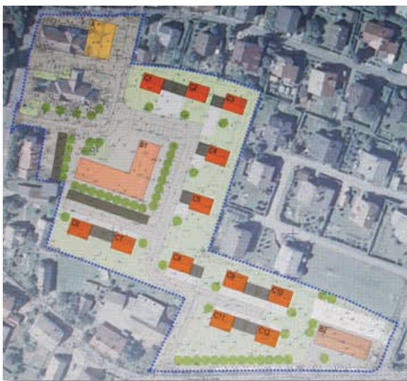
Sveta Trojica bo dobila nov center z velikim trgom, na katerem bo dovolj prostora za otroško igrišče, druženje ljudi, različne prireditve in podobno.

Za vsak kraj je njegovo središče kot za človeka obraz, saj ga vsakdo najprej opazi. Tega se zavedajo tudi v občini Sveta Trojica, zato so občinski svetniki na predlog župana in občinske uprave pred nedavnim v prvem branju obravnavali predlog »Odloka o občinskem podrobnem prostorskem načrtu za center v Sveti Trojici v Slovenskih goricah«.