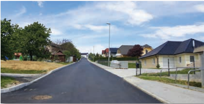
Ulica je dobila nov asfalt.