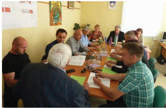
100-odstotna zasedba razprave benediškega občinskega sveta o kandidatih za ravnatelja

Razpis je vzburkal domačo javnost. Občinski svetniki so 10. maja o kandidaturah po predlogu komisije za mandatna vprašanja, volitve in imenovanja (ta ni bil soglasen) razpravljali zelo resno, niso pa se izrekli o nekaterih domnevnih v delih javnosti prisotnih in v nekaterih medijih zapisanih nepravilnostih