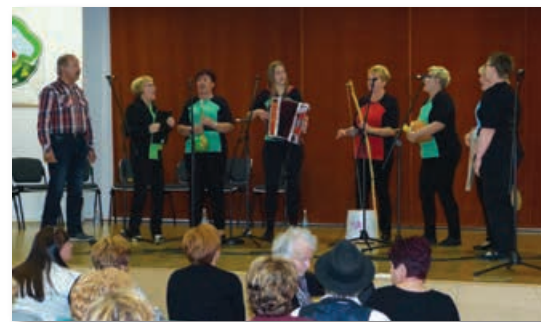
Etno skupina Šajke