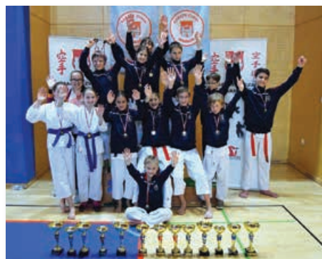
OŠ liga- skupinsko