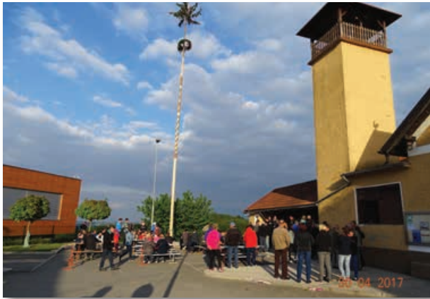
Po postavitvi mlaja v središču občine

V nedeljo, 30. aprila 2017, je potekala že tradicionalna postavitve majskega drevesa v organizaciji PGD Sveta Ana. Najprej je postavitve majskega drevesa potekala v Lokavcu pri gasilskem domu, nato pa še na Sveti Ani. Čeprav nam vreme ni bilo naklonjeno, je postavitve obeh majskih dreves uspela več kot odlično. Krajanje so tudi letos bili pogoščeni z jedačo in pijačo, prav tako pa je bilo poskrbljeno za živo glasbo.