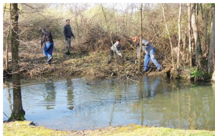
Urejanje okolice Ribiškega doma v Lenartu

Ribiška družina Pesnica – Lenart bo v letu 2017 posebno pozornost posvetila praznovanju in dostojni obeležitvi 60. obletnice svojega obstoja. Prenekateri aktivnosti potekajo že od jeseni lanskega leta. Tako smo v kontekstu praznovanja jubileja že konec leta 2016 pripravili jubilejni grb, ki ga uporabljamo v jubilej-