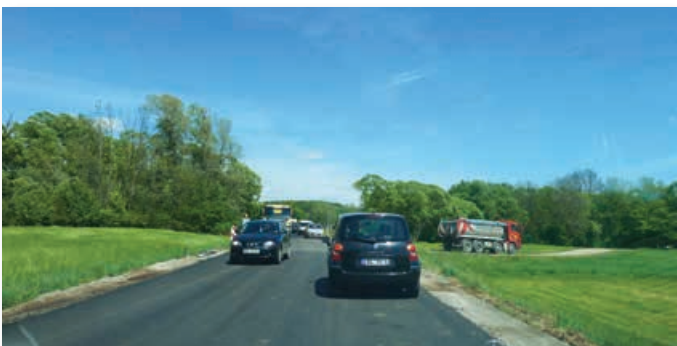
Obnova odseka ceste Lenart–Trate