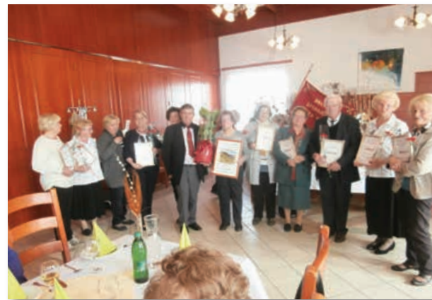
Prejemniki priznanj in zahval