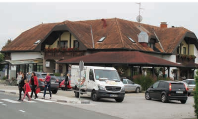
Kljub temu da sodi Benedikt med bolj razvite in urejene občine, nekatere občane pestijo socialni problemi.

Lenart, Društva upokoencev Benedikt, Društva diabetikov Lenart, Društva paraplegikov Podravja, Društva rejnic Lenart, Varstveno delovni center POLŽ Maribor in Klub krvodajalcev Benedikt.