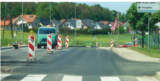
Začetek obnove odseka ceste Lenart–Trate v Lenartu