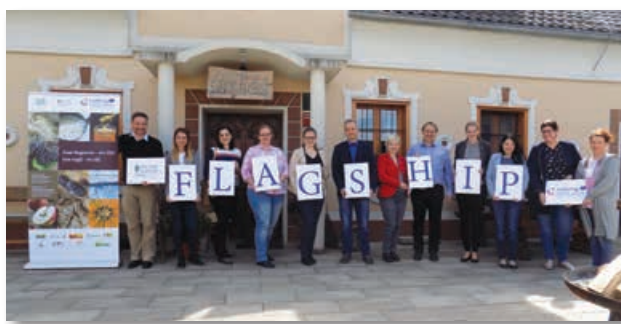
Prijazno so nas gostili na Domačiji Firbas

Vse bralce Ovtarjevih novic prijazno vabimo na sejem KOS na Poleno pri Lenartu, kjer bodo ponudniki predstavljali in tržili