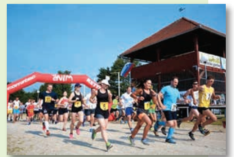
Lanski štart ...

Prijava na tek in druge aktivnosti bo možna na mestu dogodka, informacije o predprijavah in štartnini pa najdete na naši Facebook strani - www.facebook.com/drustvomladidokrajalenart Vljudno vabljeni!