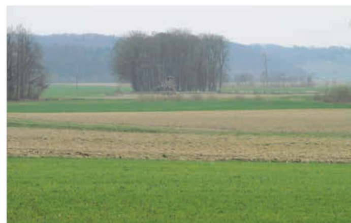
Najbolj pereči problemi, s katerimi se soočajo sodobni lovci, so vse slabši naravni pogoji in razmere za divjad.

prizna, ta naj si ne lasti tega naslova, ker si ga ne zasluži, saj je lov oni teren, kjer prenehajo vse razlike stanu, bogastva, časti itd., kjer se pozna in upošteva le ena lastnost, lastnost – lovca«. Že na samem začetku ustanavljanja slovenske lovške organizacije je bil namenjen velik poudarek lovskemu tovarištvu. Slovenski lovski klub,